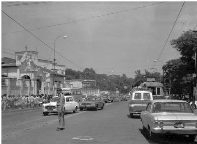
Inicios del Penal del Buen Pastor.

Estructura del Viceministerio de Política Criminal extraído de la Página Web del Ministerio de Justicia.